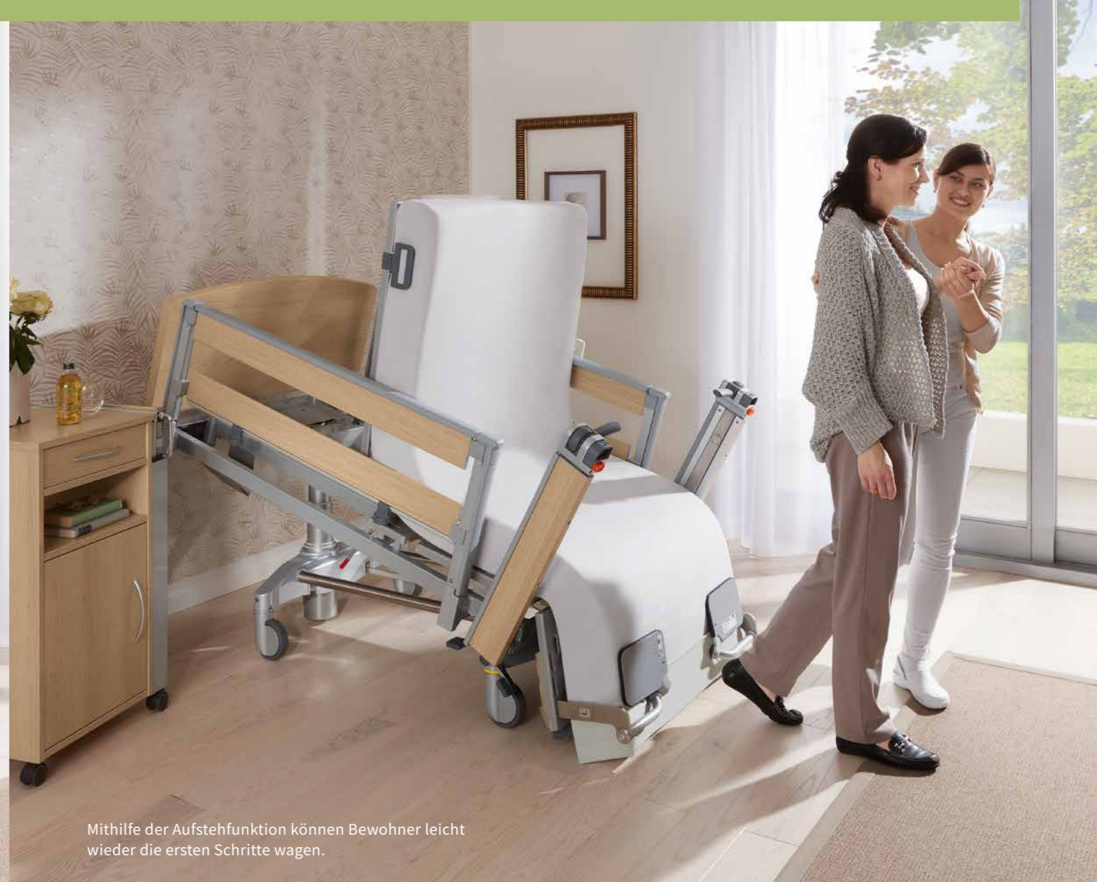
Mithilfe der Aufstehfunktion können Bewohner leicht wieder die ersten Schritte wagen.