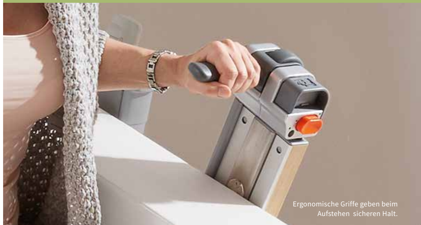
Ergonomische Griffe geben beim Aufstehen sicheren Halt.