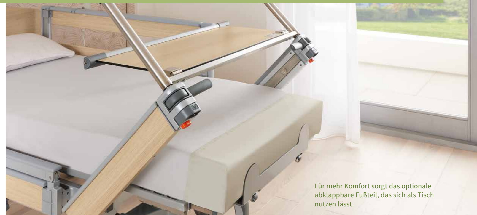
Für mehr Komfort sorgt das optionale abklappbare Fußteil, das sich als Tisch nutzen lässt.