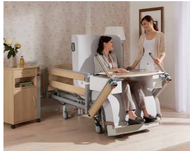
▲ Das abklappbare Fußteil kann als Tisch für Mahlzeiten oder Getränke dienen.