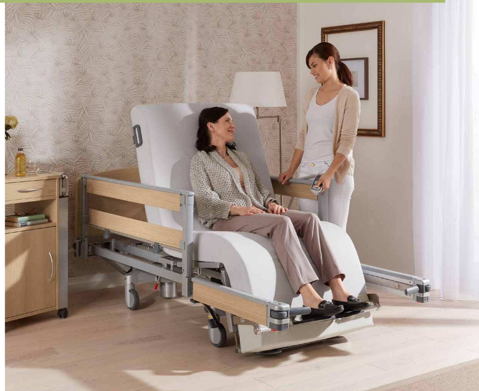
▲ Der Transfer des Bewohners in einen Sessel oder Transportstuhl kostet mit dem Vertica homecare weniger Kraft.

Physische Entlastung während der Mobilisierung