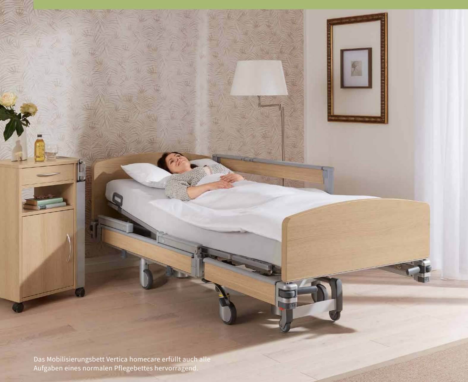
Das Mobilisierungsbett Vertica homecare erfüllt auch alle Aufgaben eines normalen Pflegebettes hervorragend.