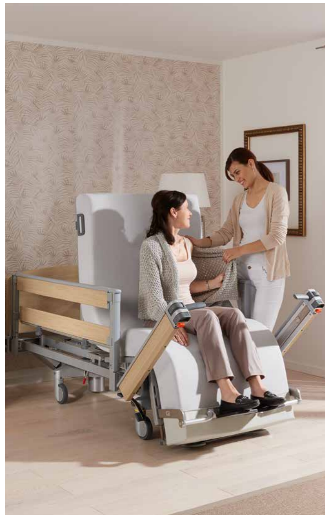
▲ Die Grundpflege fällt dem Bewohner und der Pflegekraft in der Sitzposition leichter.