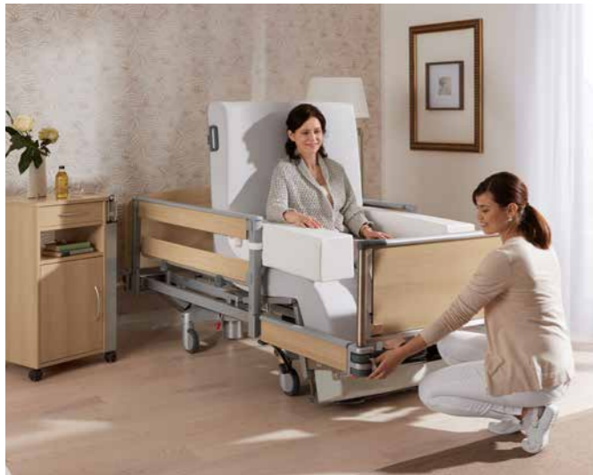
▲ Das optionale abklappbare Fußteil sorgt für mehr Lebensqualität im Alltag.