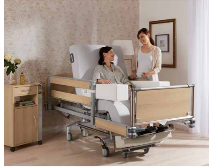
▲ Die optionalen Seitenpolster für die Arme geben zusätzlichen Halt.