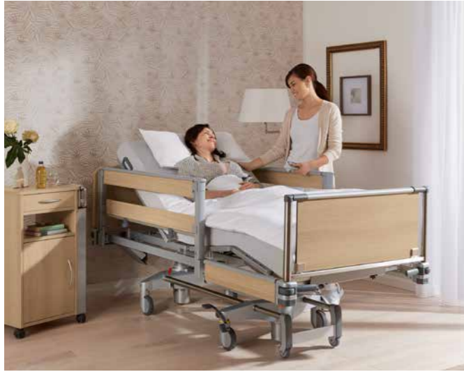
▲ Die MultiFlex-2/3-Seitensicherung ist einfach zu bedienen.